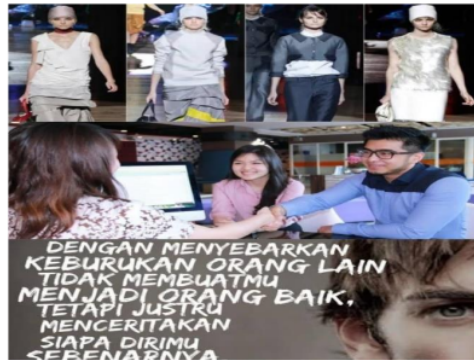
Gambar 1.2 Flexing fashion yang tidak pantas, menarik perhatian orang lain dan meneritakan kebaikan

Flexing dapat merugikan masyarakat, karena perbuatan ini sangat mendatangkan efek buruk di kalangan masyarakat, salah satunya dapat mempengaruhi orang-orang di sekitarnya. Seperti suka pamer harta, gayanya terlalu glamor, memamerkan barang-barang unik yang dimilikinya, dan berusaha menarik perhatian orang lain, memamerkan diri dengan menceritakan kebaikan dirinya. (Ety Nurhayat and Rakhmadiyah Dewi Noorrizki, 2022).